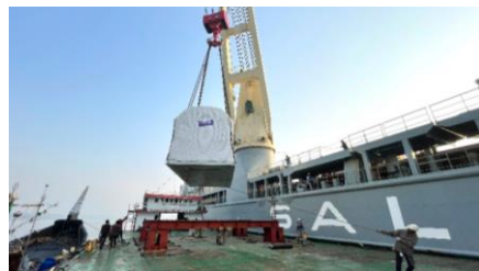
孟加拉鲁普萨800MW联合循环电站项目