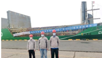
俄罗斯MMK钢厂焦化项目