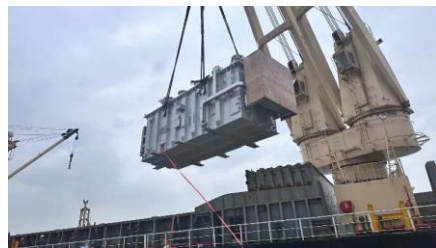
菲律宾维萨亚斯群岛变电站升级改造 总承包项目