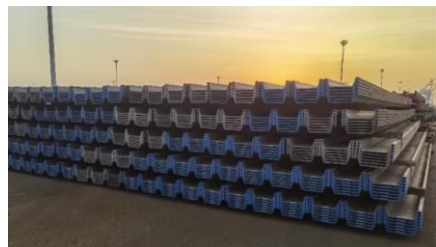
钢板桩国际运输（产品物流）