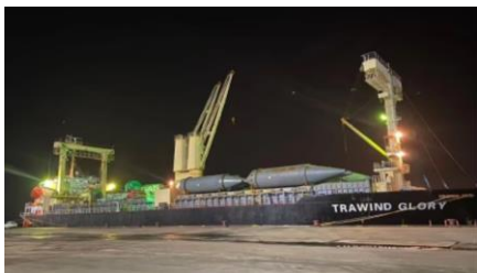
二期工程项目（整船运输）