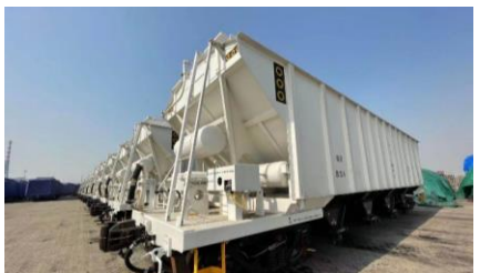
博茨瓦纳铁路公司漏斗车发运