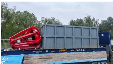
俄罗斯纳霍德卡NFP5400MTPD甲醇项目