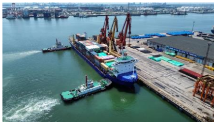
俄罗斯北极巴依姆铜矿项目