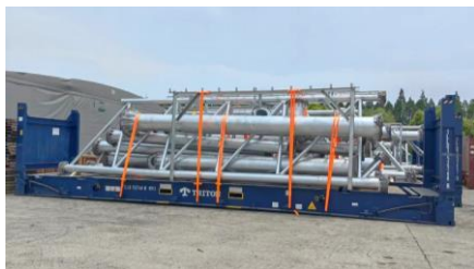
巴基斯坦SK水电站项目