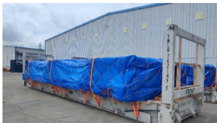
轴承门到门运输（产品物流）